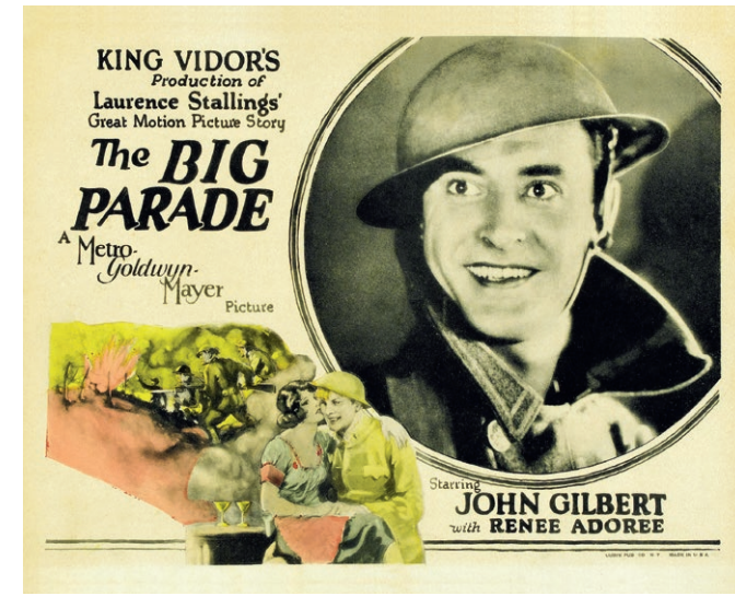
▲ Die große Parade (USA 1925)

Organisation: Deutsches Kulturforum östliches Europa und HBPG