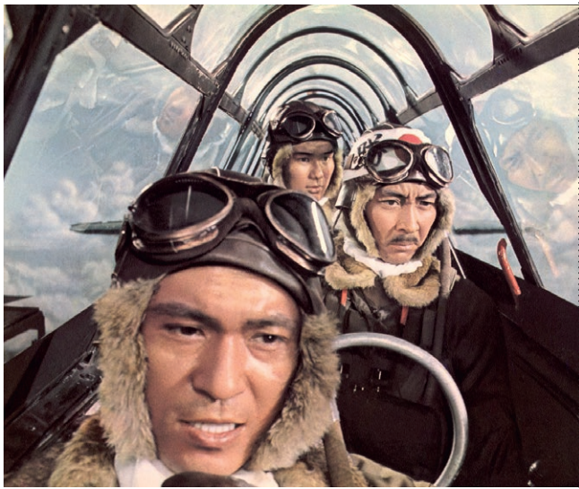
▲ Tora! Tora! Tora! (USA/JPN 1970)

Veranstaltungen des Forums Neuer Markt im Filmmuseum Potsdam mit Film und Diskussion Start jeweils um 18.00 Uhr